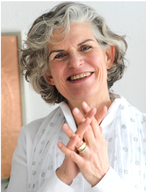
Jin Shin Jyutsu® Praktikerin und Selbsthilfelehrerin

Jin Shin Jyutsu® Physio Philosophie ist eine dreitausend Jahre alte japanische Heilkunst. Eine sanfte Methode, die den Abbau von Stress und Spannungen unterstützt.